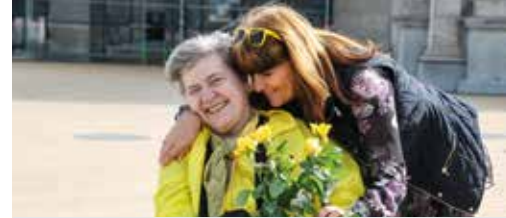
N-VA viert moeder p. 3