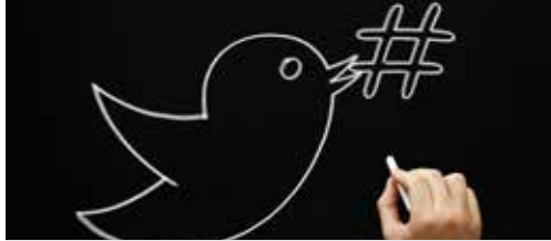
De twittermuur p. 2