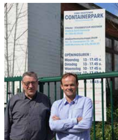
▲ Omdat het containerpark aan de Northlaan verdwijnt, stelt de N-VA een nieuwe locatie voor om u niet ver te laten omrijden.