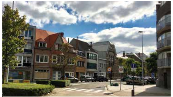
▲ Sinds de invoering van het enrichtingsverkeer, verschuiven de verkeersproblemen naar de omliggende straten en wijken.

Door werken kan je vandaag niet van de Torhoutsesteenweg tot aan de Mariakerkelaan rijden. Nu dat ook via de Kroonlaan onmogelijk wordt, gebruiken bestuurders vaak langere