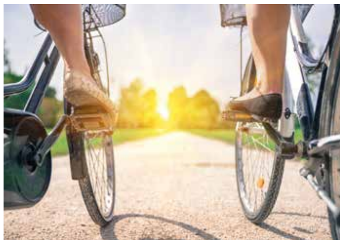
▲ Fietsers zullen door deze innovatie nog beter kunnen genieten van het landschap.

In de plaats kunnen de fietsers ten volle genieten van het landschap. “Deze meerwaarde kost de provincie niets”, besluit raadslid Coupillie. “Maar voor de hedendaagse vrijetijd fietser is zo’n GPX-bestand een zegen.”